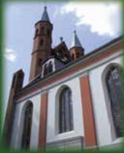
St. Marienkirche Kyritz

Im ersten Gemeindebrief des neuen Jahres finden Sie wie immer die Übersicht über die in diesem Jahr stattfindenden Kirchenmusiken als Beilage. Ein abwechslungsreiches Programm mit Jazz-, Chor-, Gospel-, Bläser- und Orgelmusik erwartet Sie. Lassen Sie sich einladen und geben Sie das Kirchenmusikprogramm gern weiter an Freunde und Bekannte. In einigen Kyritzer Geschäften, im Tourismusbüro, im Gemeindebüro und in der Kirche sind die Flyer zu finden.