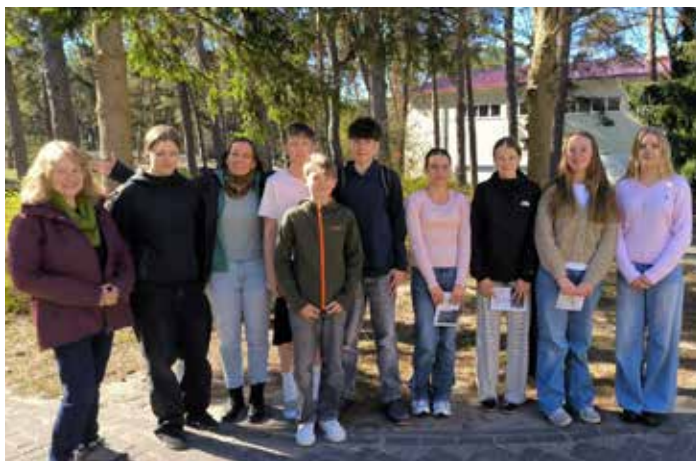
Konfis aus unserem Pfarrsprengel

Meer und Strand, Sonne und Wind, Singen und Beten, Spielen und Diskutieren, kurze Nächte und intensive Tage – das war unsere Konfi-Fahrt. Mit 40 wunderbaren Konfirmand*innen aus der ganzen Region waren wir vom 23. bis zum 26. April unterwegs in und um Zinnowitz und